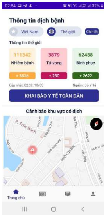
Số liệu thống kê dịch trên Thế giới